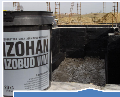
Hydroizolacje podziemne i przyziemne