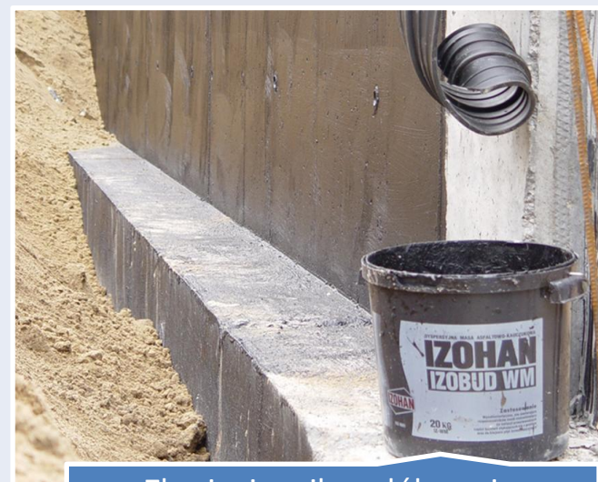
Zbrojenie mikrowłóknami – nie wymaga wkładek zbrojących