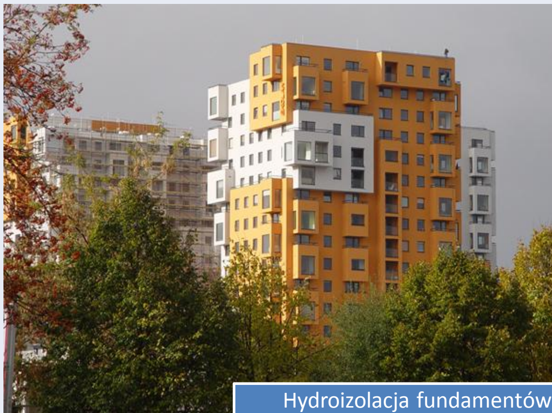
Hydroizolacja fundamentów Osiedle „Horyzont” w Gdańsku