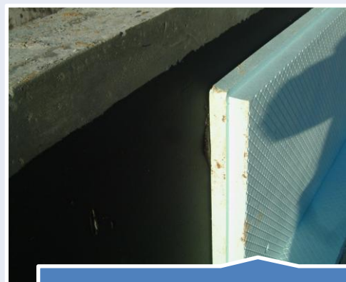
Przyklejanie płyt styropianowych EPS i XPS